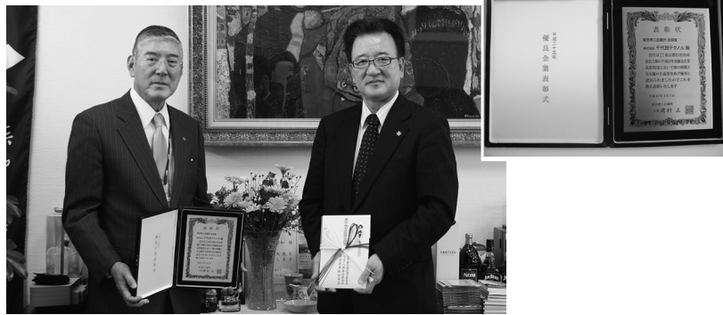
表彰状を手にする細田社長（左）と安川本部長